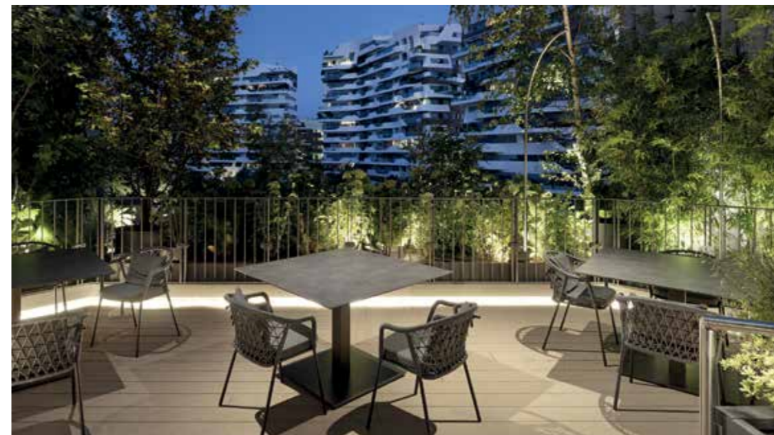
La terrazza di 600 mq sospesa appena sopra le fronde degli alberi è uno spazio per 90 coperti. Per arreararla sono state scelte le sedute Panarea di CMP Design per Pedrali in terracotta e grigio antracite che si caratterizzano per l'intreccio artigianale in corda di polipropilene.

I ristoranti dei grattacieli devono rievocare le atmosfere delle grandi metropoli come New York, Tokyo o Shanghai