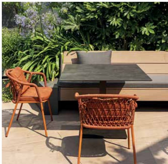
La terrazza, affacciata sul quartiere di Citylife rappresenta la seconda sala del ristorante posto al primo piano della Torre Allianz.

I ristoranti dei grattacieli devono rievocare le atmosfere delle grandi metropoli come New York, Tokyo o Shanghai